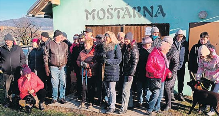
Sraz byl tradičně u moštárny v Chodské Lhotě.

Tradiční pochod pořádali zahrádkáři z Chodské Lhoty loni 29. prosince a zúčastnilo se 31 osob. Zahrádkáři se vydali směrem k Prostředňáku. Na vrchu „Ve Studeným“ jsme nabrali směr Javorovice a mezi lesy Přední a Zadní Javorovice do osady Výrov. Na Výrově jsme všem ukázali, kde se v této osadě nachází rozvodí řek. Zašli jsme k prameni Chalupského potoka a okoukli stále