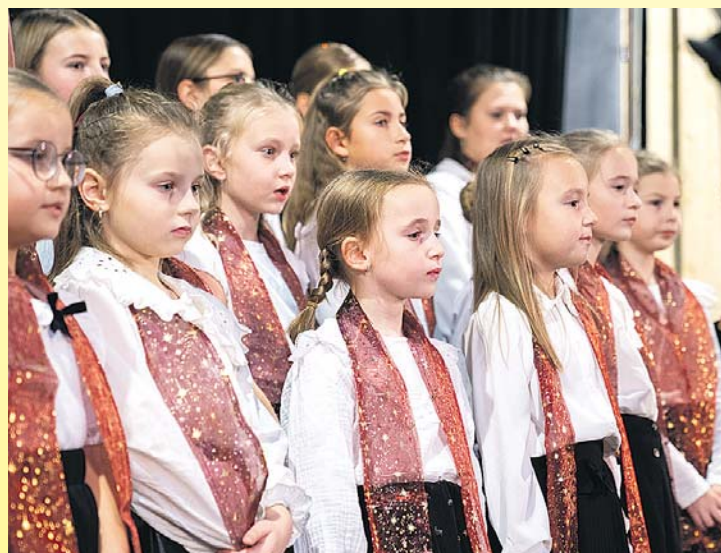
Také v Kolovči zpívali koledy s celým Českem. Více str. 2, foto Petr Dolejš