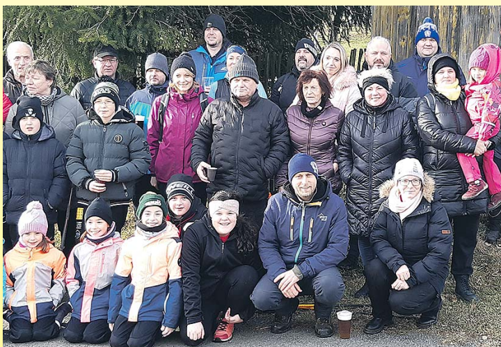
20. ročník novoročního pochodu ke kapličce na Ulíkově, který pořádá obec Němčice ve spolupráci s SDH Němčice. Tohoto výšlapu se účastnili i letos ve velkém počtu Stanětičtí.