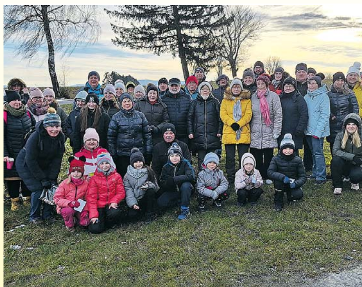
Novoroční vycházka v Mrákově.