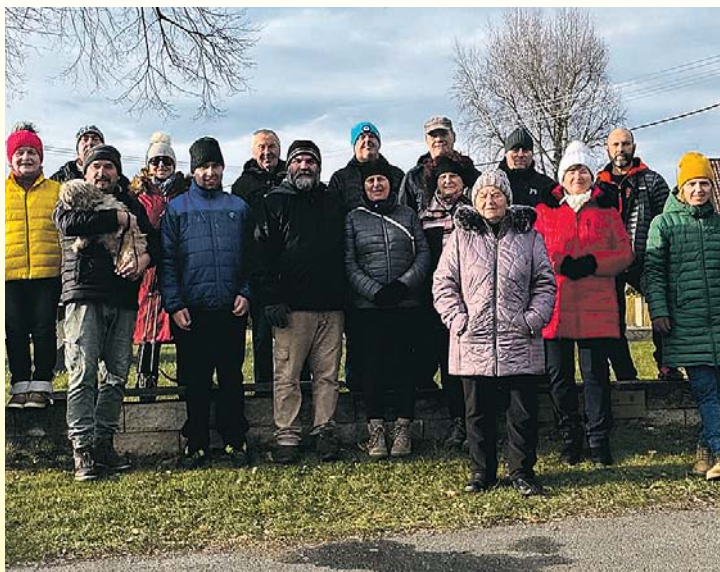
V Brnířově vyrazili na novoroční pochod po třícáté.