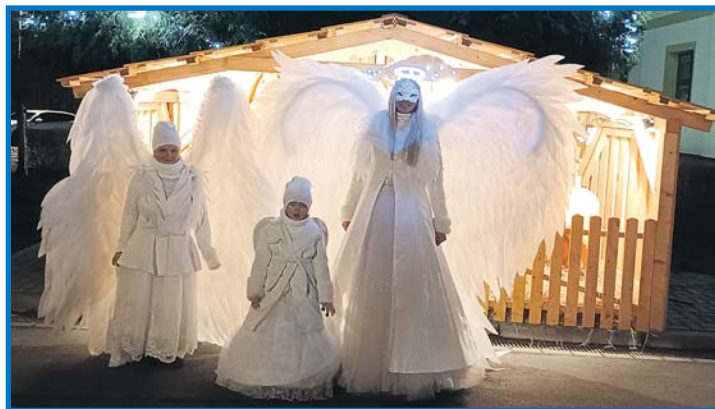
V Pocinovicích rozsvítili vánoční strom s anděly.