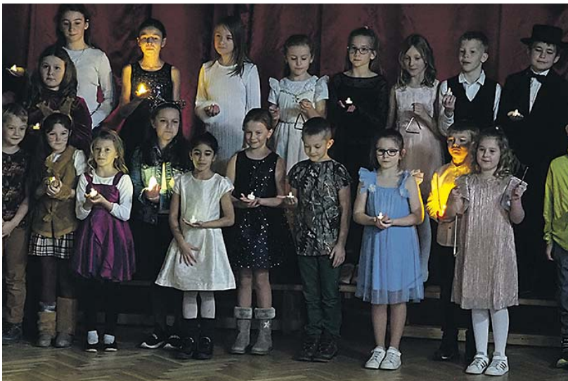
Děti z Mateřské i Základní školy v Pocinovicích potěšily svým vystoupením před Štědrým dnem nejen rodiče zš