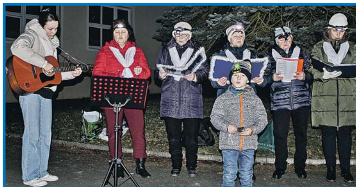
V Loučimi vystoupil s patnáctiminutovým programem za doprovodu kytary místní příležitostný pěvecký soubor s malým předzpěvákem a hráčem na zvoneček. Z. Huspek