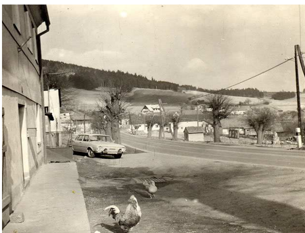
Obecní váha na snímku z roku 1978 – malá budka u pravé strany silnice.