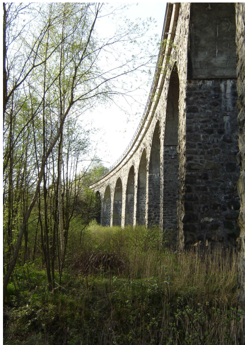
Smržovické mosty na současném snímku

_21.5. byla částečná mobilizace a museli ihned nastoupiti vojenskou službu Antonín Mráz čp. 11 a Jiří Blahník, kteří tam museli být 4 týdny. Následkem této mobilizace nastaly v obci noční hlídky na návsi a státní dráze, které museli dělati zdejší občané pod dozorem zdejšího Sokola.