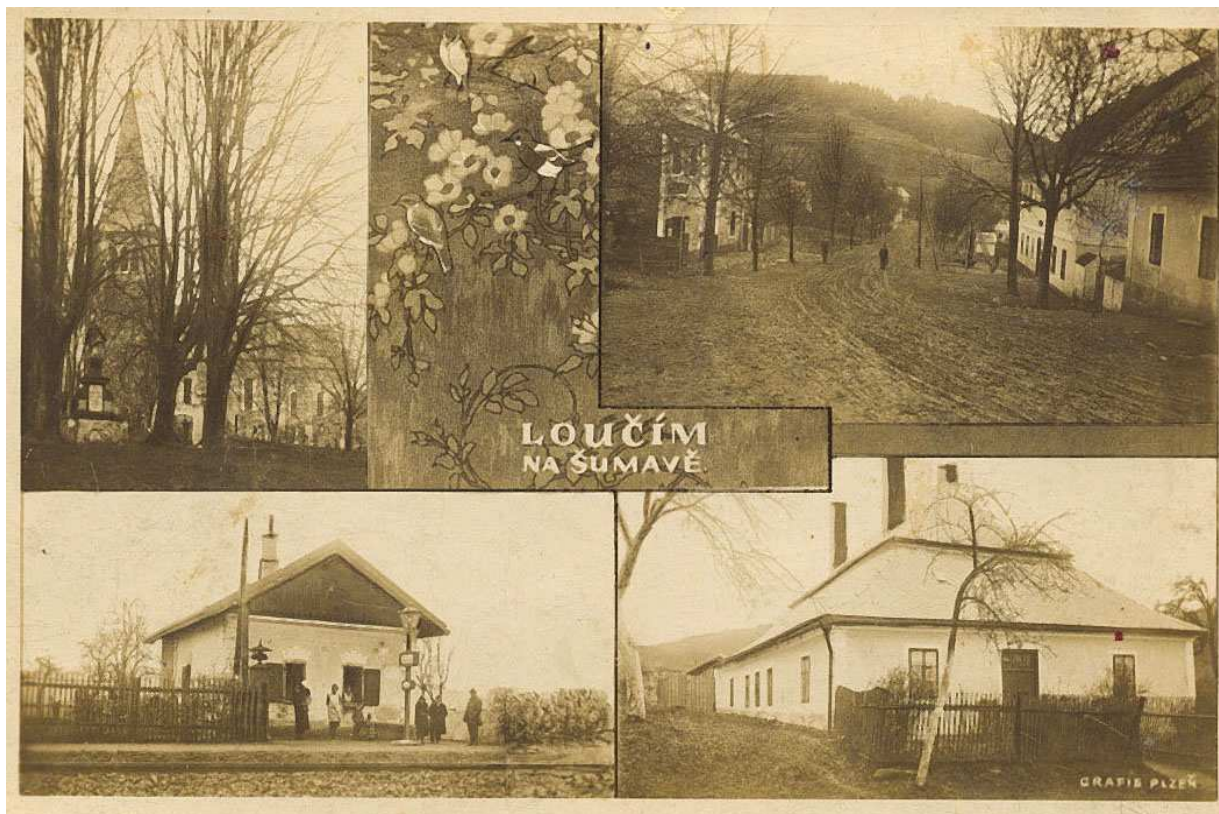
Pohlednice Loučimi z roku 1931