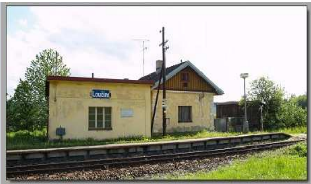
Zastávka Loučim z roku 1931 a 2007

Podle nařízení c.k. okr. hejtmanství v Domažlicích provedl sčítání lidu v Loučimi p. učitel K. Vilímec – napočteno 310 obyvatel. Dne 10. září 1911 kolem 1. hod. odpoledne letěl veliký balon se vzduchoplavci směrem od Ovčina k Dobré vodě, balon se vznášel nad Lhotou a za Jezvincem zmizel. Balony letěly dosti nízko nad zemí, poněvadž bylo možno dobře rozeznati jejich prapory. Byly to snad první balony, jež nad zdejší krajinou letěly.