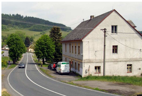
Bývalá škola, dnes obecní úřad a knihovna

téhož roku byla budova vysvěcena a předána školnímu správci.